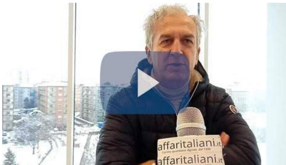
Ferrari, Studio FZ Milano: "Welfare e sostenibilità al centro del progetto"